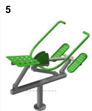
5 URZĄDZENIE SPRAWNOŚCIOWE WIOŚLARZ