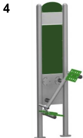
4 URZĄDZENIE SPRAWNOŚCIOWE PROSTOWNIK PLECÓW